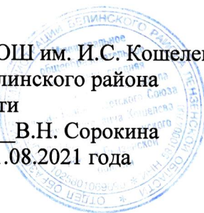
График посещения пищеблока членами комиссии по родительскому контролю за организацией питания обучающихся на 2021-2022 учебный год.